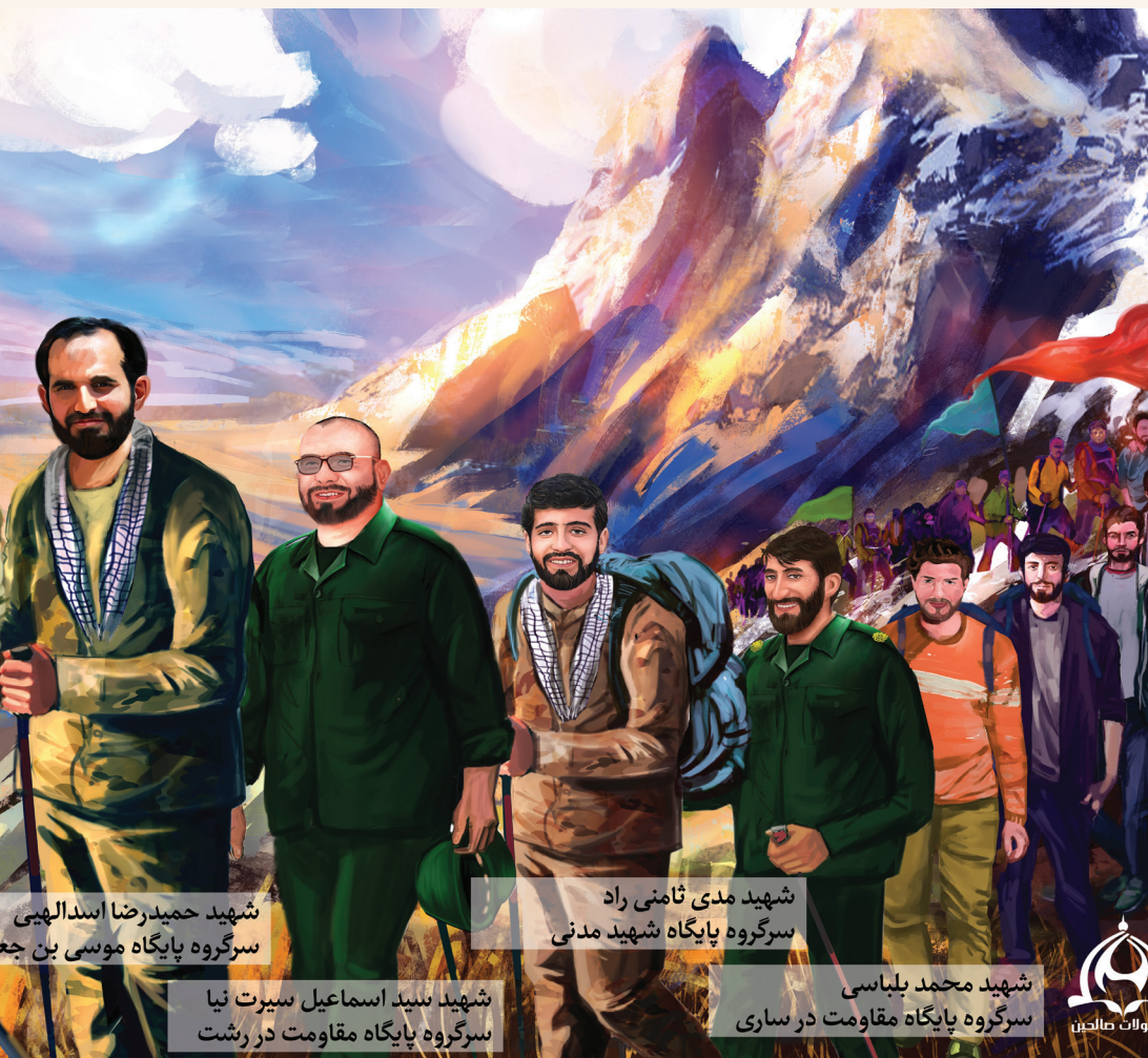
شهید حمیدرضا اسدالهی سرگروه پایگاه موسی بن جعفر