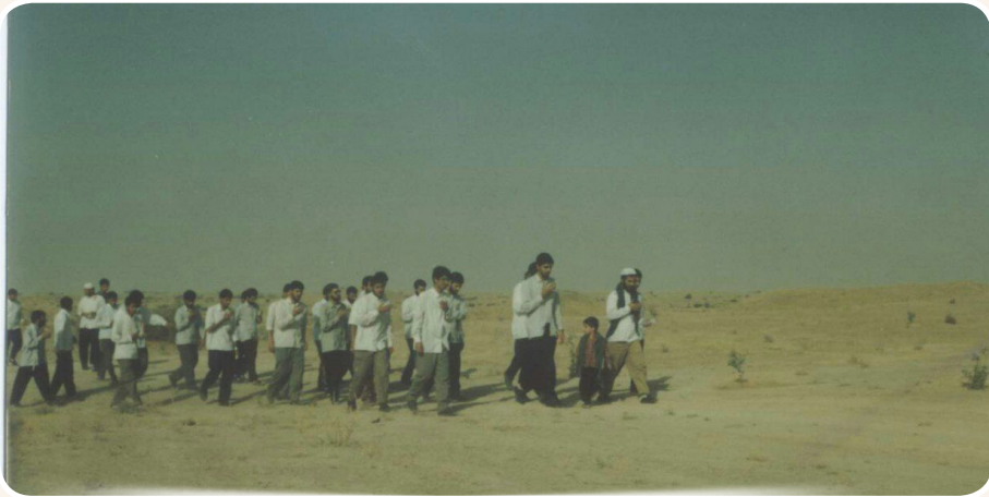
برنامه های جانبی مسجد موسی بن جعفر (ع) برای جذب و تثبیت و همچنین رشد اعضاء

را پذیرش می‌کرد که فقط به همان سبک سنتی درس بخوانند، اما امروز طلبه هایی را می‌پذیرد که کار تربیتی در مساجد کرده باشند، چون مسجد را پشتوانه خودش می‌داند. در واقع نیرویی که از مجد وارد حوزه می‌شود، یک نیروی آماده و باتجربه است. از همان اول، شخص خودش روی دور افتاده است و لازم نیست چندسال در حوزه بگذرد تا شخص آماده شود. حوزه از طرف دیگر خودش را متکفل امور مساجد می‌داند و حوزه تا حدودی نیروهای درون مساجد را به لحاظ علمی تأمین می‌کند و ارتباط نزدیکی بین حوزه و فعالان مسجدی وجود دارد. الآن هنگام غروب -موقع نماز مغرب و عشا- همه طلبه‌ها وارد مساجد شهر می‌شوند.