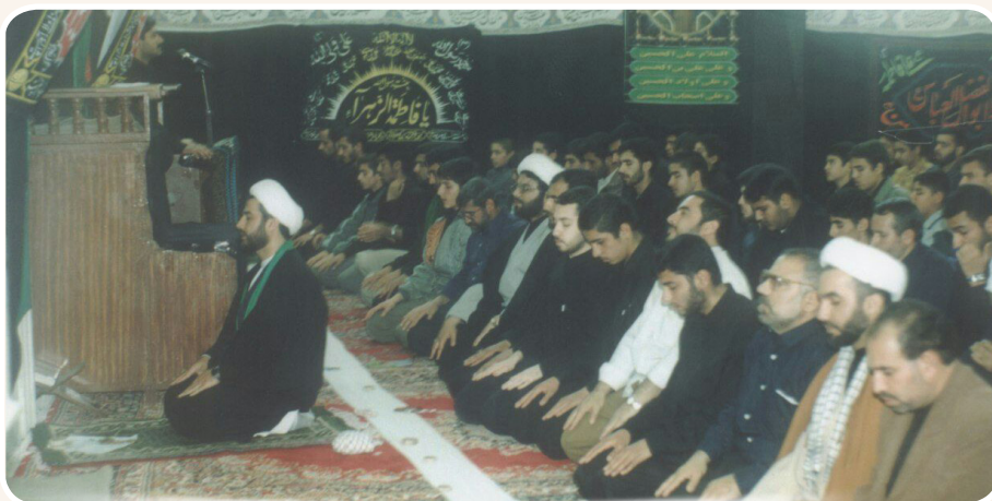
حضور حجت الاسلام و المسلمین سعید دسمی در مسجد موسی بن جعفر (ع) اهواز و جذب دهه‌ها جوان و نوجوان به مسجد - دهه هفتاد

هدف ما از جمع شدن دوره‌م، ساختن دیگران نبود بلکه خودسازی بود. جلسه قرآن برگزار نمی‌کردیم که دیگران قرآن بیاموزند بلکه برای این بود که خودمان از قرآن استفاده کنیم؛ لذا در جلسات صریح و رک اشکالات همدیگر را بیان می‌کردیم. گاهی این امر به دعوا و ناراحتی هم می‌کشید؛ اما چنان روح اعتمادی بر جمع حاکم بود که برای مثال وقتی اشکالات را به من می‌گفتند، می‌فهمیدم که این برای کمک به خودم است و برای رشد من، نه برای خرد کردن شخصیت من انجام می‌دهند. ما سعی کردیم در این جمع، اصول اولیه اسلامی مانند امر به معروف و نهی از منکر، تذکر دادن، رشد دادن و... را پیاده کنیم. همین بحث‌ها برای ما تشنگی ایجاد می‌کرد و می‌فهمیدیم خیلی چیزها را بلد نیستیم، احساس کمبود می‌کردیم؛ لذا می‌رفتیم مطالعه می‌کردیم. انگیزه مضاعفی برای مطالعه آثار شهید مطهری ایجاد شده بود که ما ساعت‌ها حتی در جبهه، کتاب مطالعه کنیم. در مباحث معرفتی از کتب شهید مطهری بهره می‌گرفتیم.