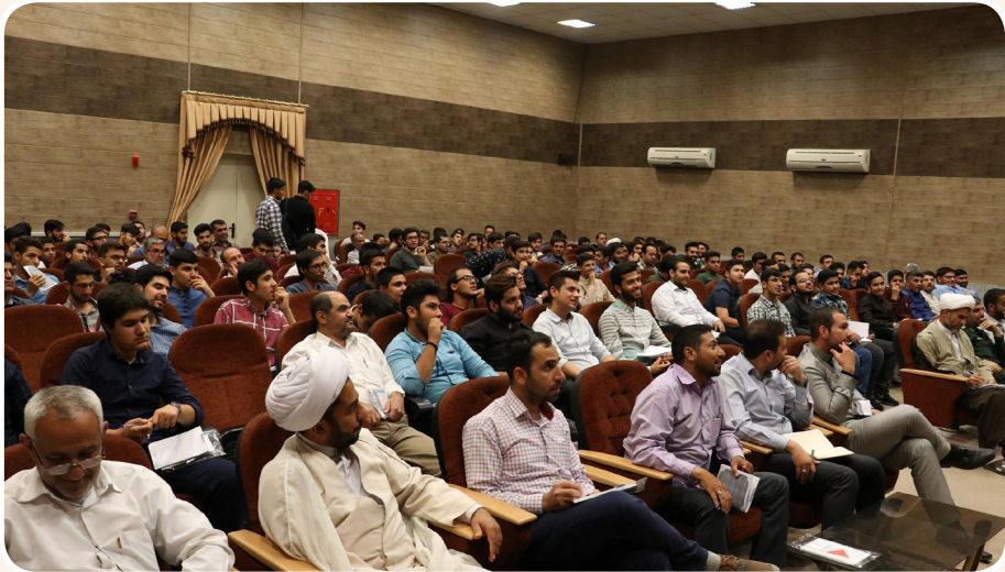
تصویر: برگزاری دوره آموزشی ویژه سرگروه های حلقه های صالحین حوزه ها و پایگاه ها توسط معاونت تعلیم و تربیت سپاه ناحیه بقیه الله(عج) شیراز - ۱۳۹۷

در حلقه‌ها، مطالعات کتب شهید مطهری بود، کلیات این موضوعات در قالب ۵ روز آموزشی برای سرگروه‌ها تبیین می‌شد که مرحله دوم آموزش‌ها را در مجموعه برنامه اردوی راهیان نور طراحی نمودیم.