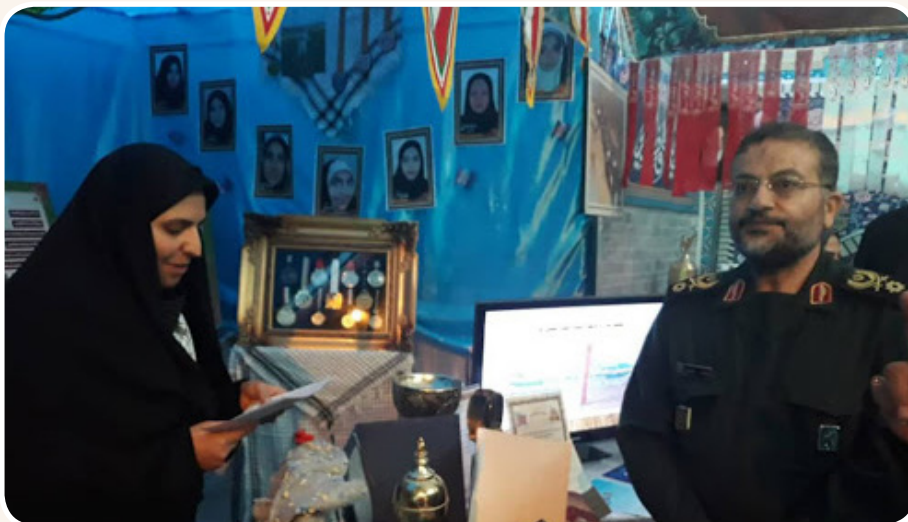
حضور سردار سلیمانی، فرمانده محترم سازمان بسیج مستضعفین در نمایشگاه دستاوردهای پایگاه‌های اسوه بسیج