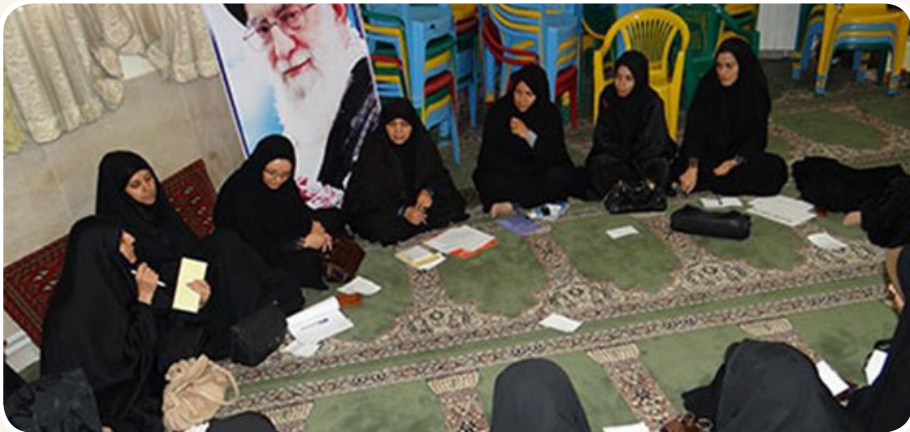
تصویر: حلقه سرمربیان خواهر بسیج نیشابور - ۱۳۹۵